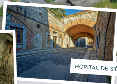
HÔPITAL DE SIÈGE