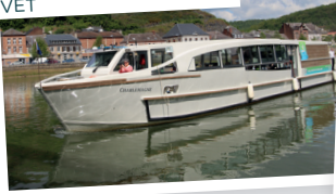
CROISIÈRE SUR LA MEUSE GIVET