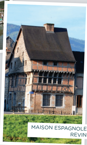
MAISON ESPAGNOLE REVIN