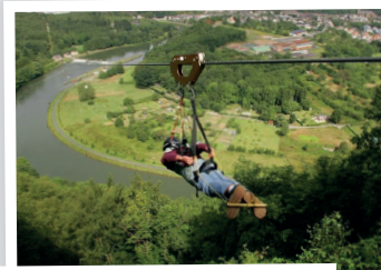
PARC DE LOISIRS TERRALTIITUDE FUMAY